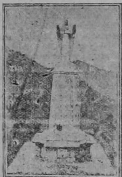
El Monumento a Cristo Rey, tal como aparecía en el Cerro del Cubilete antes del 30 de enero